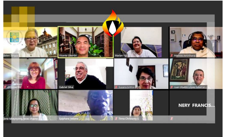
6 ICLDF Meets APCLDF

Le dimanche 16 mai 2021, le Conseil International des Fraternités Laïques Dominicaines (ICLDF) a tenu une réunion fraternelle avec le Conseil Asie-Pacifique des Fraternités laïques dominicaines (APCLDF).