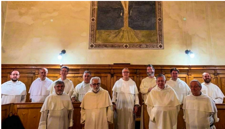
2 Prieur provincial – Chapitre de la Province Romaine de Sainte Catherine de Sienne