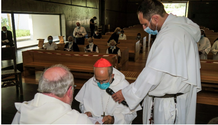
7 Le cardinal José Tolentino de Mendonça est devenu membre de la Famille dominicaine.

Lors d'un rite solennel célébré pendant les vêpres du 4 août 2021, le cardinal José Tolentino de Mendonça, théologien et poète, archiviste et bibliothécaire de la Sainte Église romaine, est devenu membre de la Famille dominicaine en faisant profession dans les Fraternités sacerdotales de Saint Dominique.