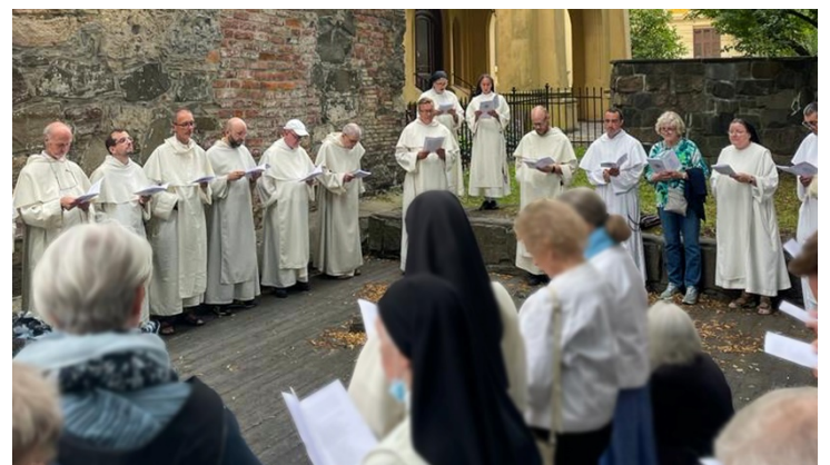
8 La famille dominicaine a fêté le jubilé

Du 6 au 8 août, à Oslo, la famille dominicaine a fêté non seulement notre père saint Dominique, mais