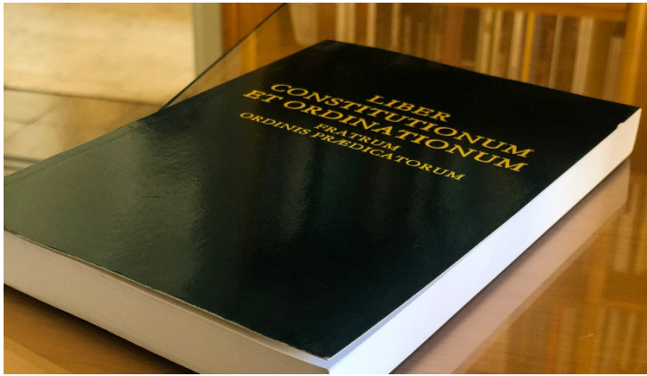
3 Livre des Constitutions et Ordinations des Frères de l'Ordre des Prêcheurs

L'édition 2021 des Constitutions des frères dominicains a été publiée.